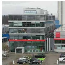
Bystronic Laser AG