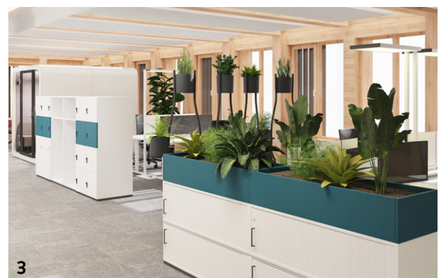
1, 2, 3 Planung & Visualisierung: Planungsabteilung Büro Keller