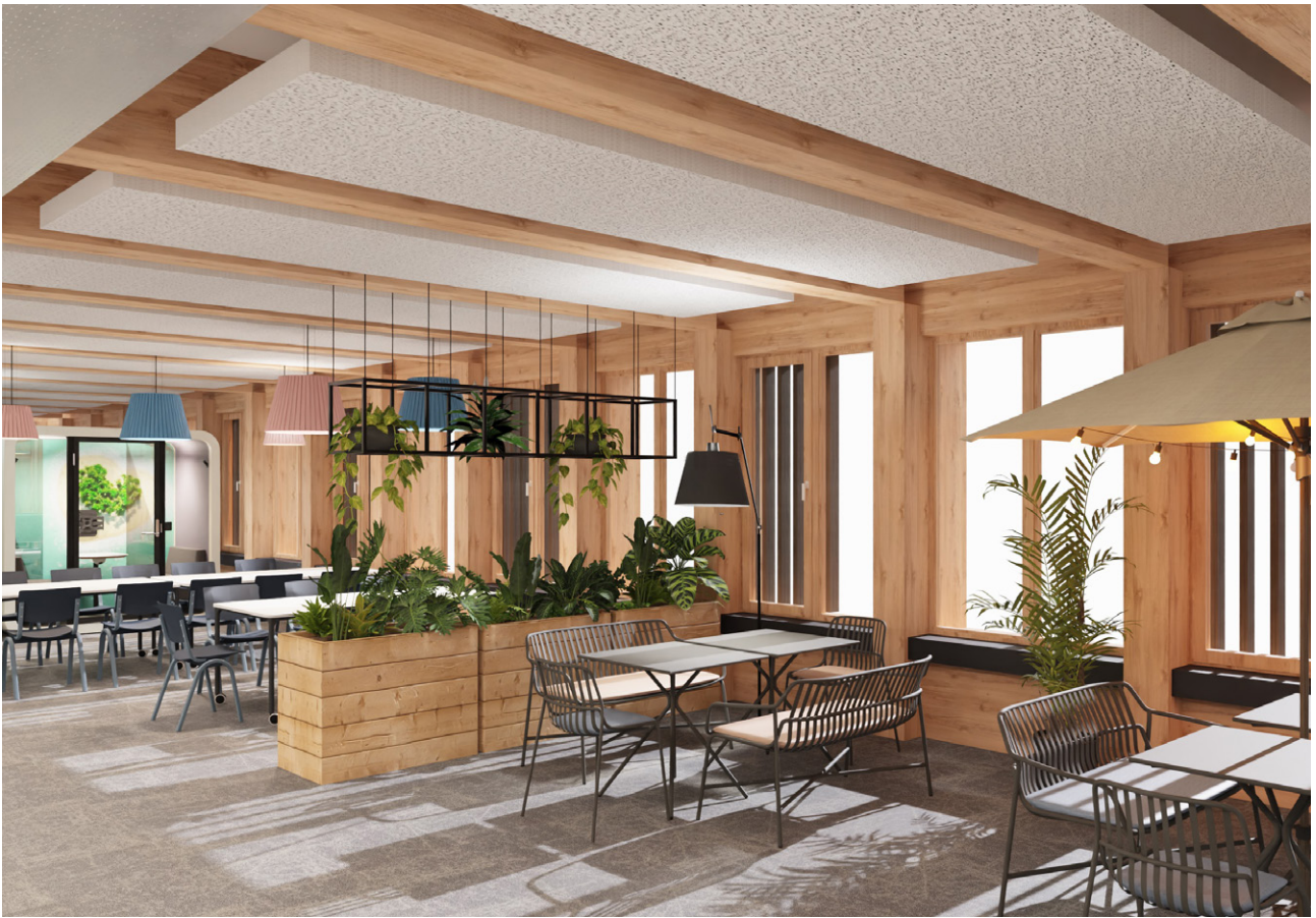
Planung & Visualisierung: Planungsabteilung Büro Keller