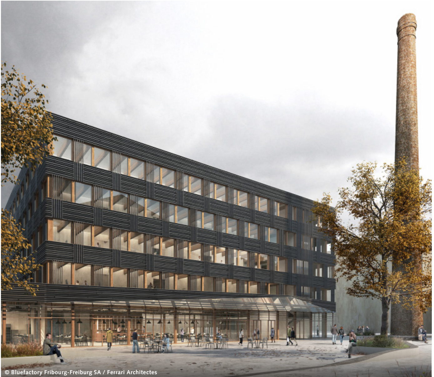
© Bluefactory Fribourg-Freiburg SA / Ferrari Architectes